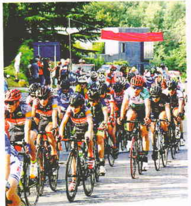
Un passaggio degli Esordienti 1° anno